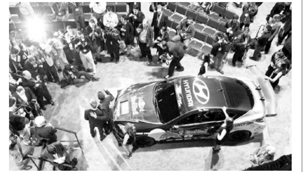
11일(현지시간) 열린 '2009 시카고 오토쇼'에서 현대차의 제네시스 쿠페가 플래시 세례를 받고 있다.