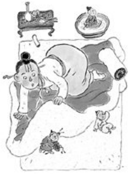
김병하씨의 '도토리 신랑'

의 내용을 들려주는 '보고 읽고 노는 그림자 놀이' 행사가 열린다. 전문 그림자 놀이팀이 '오징어와 검박' 동화책을 그림자를 이용해 들려주는 행사다. 참가비 5천원. 문의 062-510-0240.