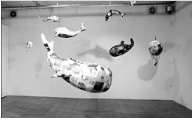
'하늘을 나는 고래'

꽃샘추위로 잔뜩 움츠렸던 마음을 활짝 열어 줄 봄맞이 어린이 문화행사가 풍성하게 마련됐다. 갑자기 추워진 날씨로 아이들 봄방학 나들이 계획을 미루고 있다면, 어린이들에게 꿈과 희망을 줄 수 있는 전시회와 신나는 뮤지컬을 만끽해보자. 아이들이 직접 동화속에 담긴 그림을 전시실에서 감상할 수 있고, 뮤지컬 속 주인공 '강아지똥'을 직접 만드는 등 체험형 부대 행사도 다채롭게 펼쳐진다.