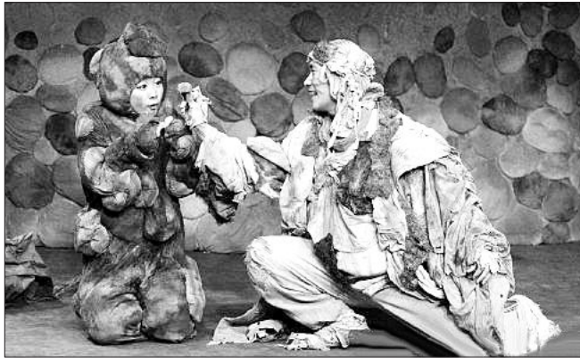
어린이 뮤지컬 '강아지똥'

꽃샘추위로 잔뜩 움츠렸던 마음을 활짝 열어 줄 봄맞이 어린이 문화행사가 풍성하게 마련됐다. 갑자기 추워진 날씨로 아이들 봄방학 나들이 계획을 미루고 있다면, 어린이들에게 꿈과 희망을 줄 수 있는 전시회와 신나는 뮤지컬을 만끽해보자. 아이들이 직접 동화속에 담긴 그림을 전시실에서 감상할 수 있고, 뮤지컬 속 주인공 '강아지똥'을 직접 만드는 등 체험형 부대 행사도 다채롭게 펼쳐진다.