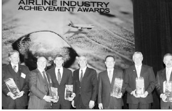
아시아나 항공 운영부 사장(오른쪽 세번째)이 17일(현지시간) 상을 수상한 뒤 ATW(Air Transport World) 관계자 및 수상자들과 기념촬영을 하고 있다.

정성 등에서 '항공업계의 노벨상'으로 평가받고 있다. 아시아나항공 운영부 사장은 수상 소감에서 "창립 21주년 기념일에 모든 항공사가 열원하는 올해의 항공사 상을 받게 돼 의미가 더 크다"며 "고객이 만들어주시는 상인만큼 세계 최고 수준의 안전과 서비스로 보답하겠다"라고 말했다. /최재호기자 lion@kwangju.co.kr