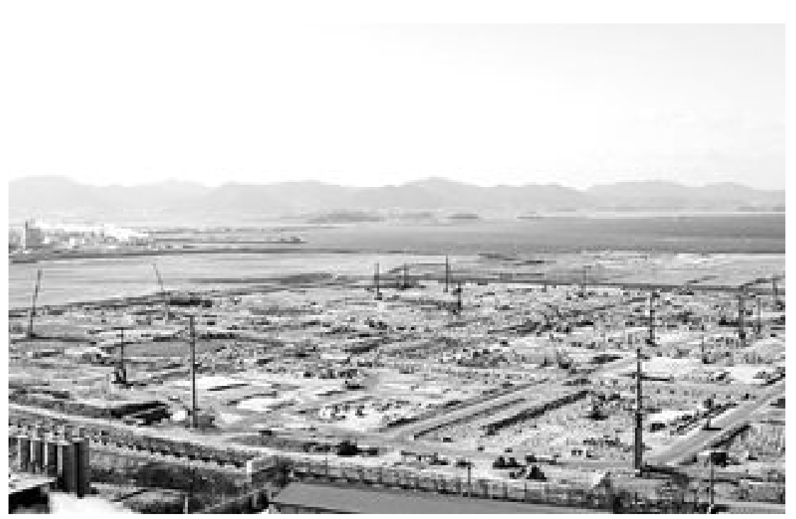
GS칼텍스 여수 제2공장 내 제3 고도화 시설 공사현장. 현재 20%의 공정을 보이고 있으며 오는 2012년 완공된다.

해종합건설(주), ㈜새한종합건설 등이 대거 입찰에 참여했다. 앞서 ‘영산강 뚫개 외 3개소 보강공사(사업비 223억원)’는 330개 업체가, ‘지석지구 생태하천 조성공사(86억원)’에는 모두 991개 업체가 몰린 것에 비춰볼 때 향후 진행될 200억~300억원에 이르는 ‘나주 영산 2지구 생태하천 조성공사’, ‘합평 1·3지구 생태하천 조성공사’에도 수주전이 치열할 것으로 예상된다. 다 지역에서 진행되는 ‘경인 운하 건설 사업’과 ‘새만금 방주제 건설공사’ 등에 관심을 보이고 있는 지역 건설사들도 많다. 금광기업(주)이 경인운하 수주에 뛰어들어 이어 새만금 방주제 건설공사 입찰 참여를 검토중이고 동광건설도 경인 운하 사업에 뛰어들었다. /김지용기자 dok2000@kwangju.co.kr