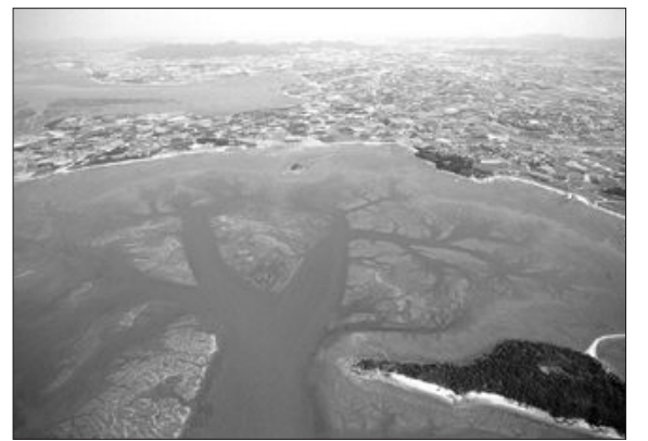
위직량 작 '무인 갯벌'

역사를 기록하는 사진기자, 그들은 한 장의 사진을 찍기 위해 현장을 떠나지 않는다.