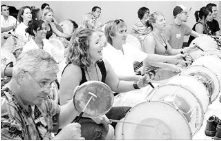
국립광주박물관이 봄을 맞아 다양한 프로그램을 마련했다. 사진은 지난해 열렸던 밀리터리 뮤지엄(사진 위)과 광주지역 거주 외국인 사물놀이 체험 행사 모습.

면 방문 교육이 가능하다. 선조의 지혜가 담겨 있는 '옛 책 만들기', 참가자들이 가족이나 애인에게 정성스런 어린이와 청소년을 위한 행사도 풍