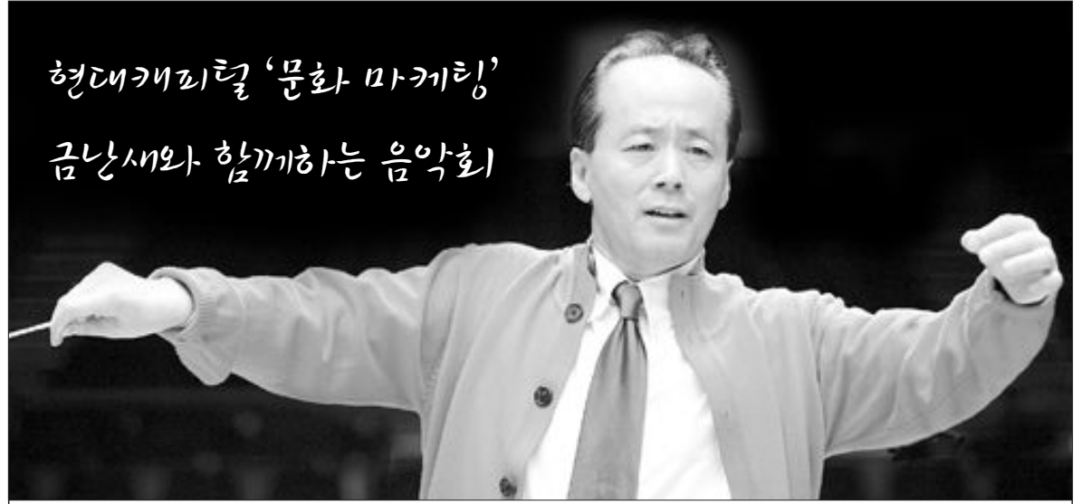
현대캐피탈 '문화 마케팅' 금남새와 함께하는 음악회