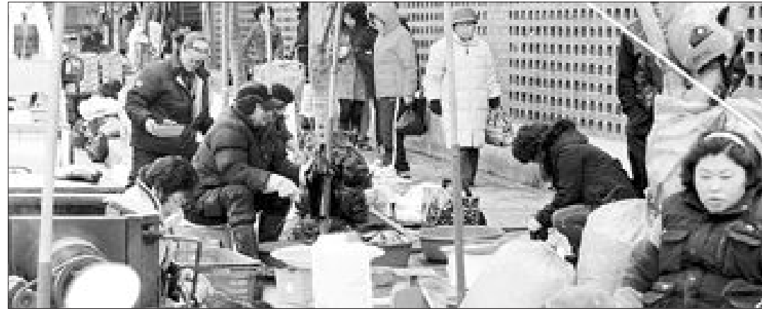
지난 20일 오후 상무시장에는 쌀쌀한 날씨에도 사람들의 발길이 끊임없이 이어졌다.

도심 골목시장인 광주 상무시장의 진화가 눈부시다. 아파트와 상가 사이 인도에 자연스럽게 형성된지 10여년만에 여는 재래시장을 능가하는 호황을 누리면서 도심 골목시장의 성공 가능성을 보여주고 있다.