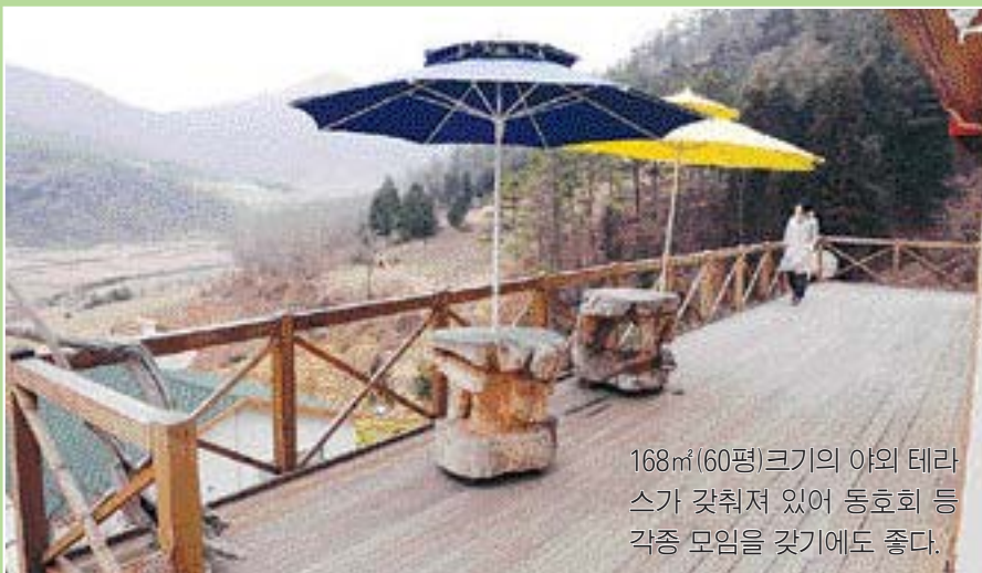
168㎡(60평) 크기의 야외 테라스가 갖춰져 있어 동호회 등 각종 모임을 갖기에도 좋다.