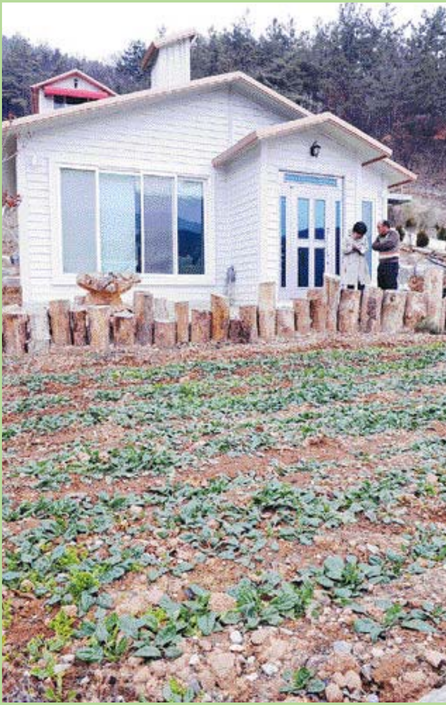
집 앞마당에는 66㎡(20평) 크기의 텃밭도 조성돼 있어 각종 채소를 직접 재배할 수 있다.