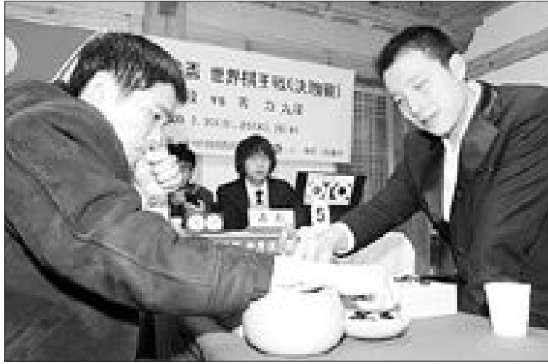
이세돌(왼쪽) 9단이 지난 25일 한·중 랭킹 1위가 맞붙은 제13회 LG배 세계기왕전 결승에서 구리 9단에게 무릎을 꿇었다.

중 구리 9단, 이세돌 연파 LG배 기왕전 우승 후지쓰배·도요타배 등 국제대회 4관왕 등극