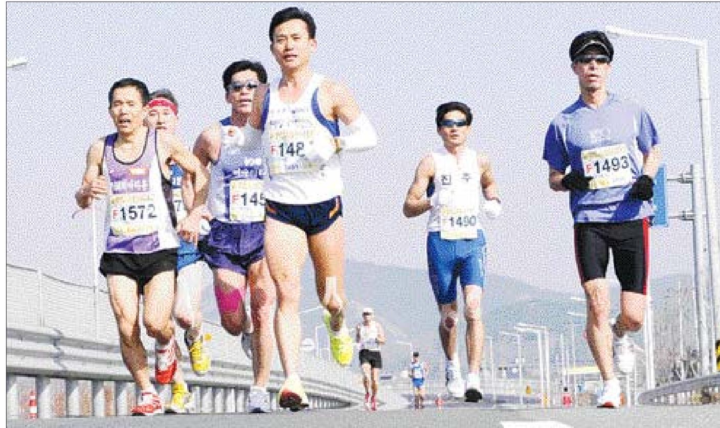
반환점 앞두고... 폴코스 20km 지점 오르막길. 반환점을 앞두고 주자들이 지친 기색없이 힘차게 달리고 있다.