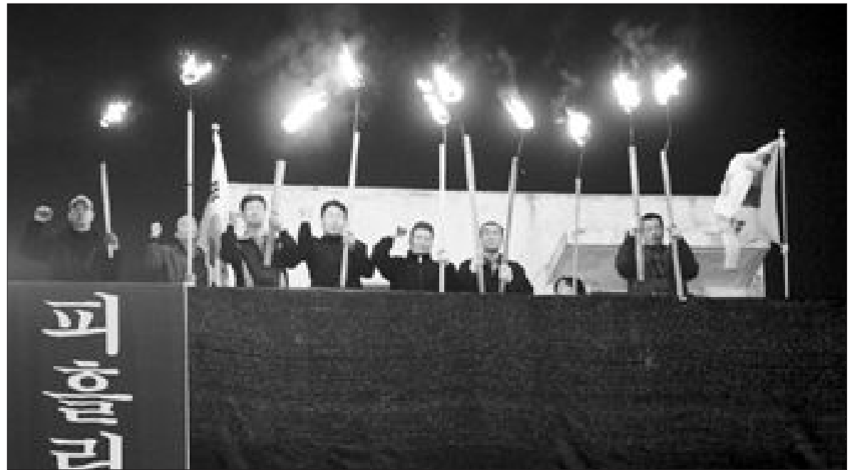
5월 단체 촛불 시위 5·18 유공자회와 5·18부상자회가 2일 밤 옛 전남 도청 별관 옥상에서 '별관 철거 반대 촛불' 시위를 벌이고 있다.

다. 이들은 이날 추진단에 발송한 공문에서 "안전펜스를 설치하는 것은 5월 단체를 문화전당 공사를 방해하는 집단으로 매도하기 위한 술책이다"며 펜스 설치에 반대했다. 또 옛 전남도의회 건물을 철거할 경우에도 건물의 전면이 아닌 후면에서 작업할 경우 협조하겠다고 밝혔