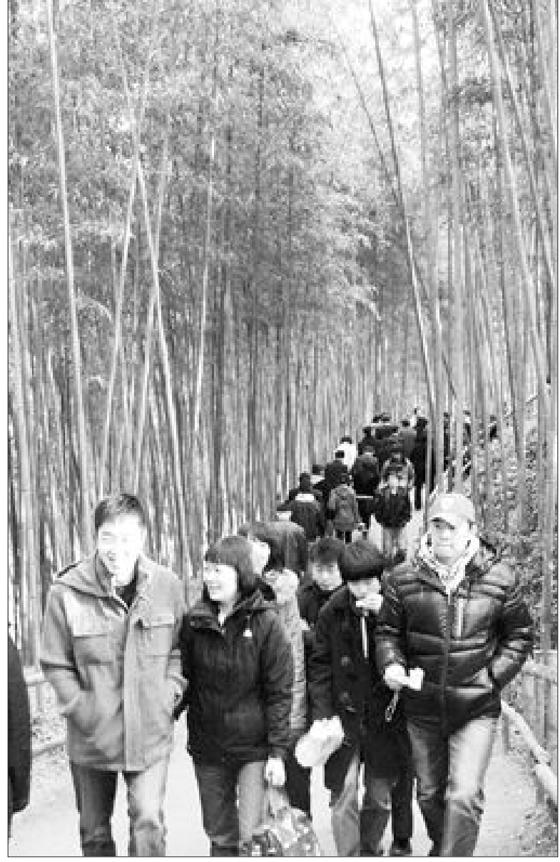
담양 죽녹원 봄 관광객 북적 죽녹원이 관광객들로 북적고 있다. 담양군에서 조성한 죽녹원은 대나무 사이를 거닐며 죽녹원을 즐길 수 있다. /담양=노정훈기자 cjoh17@

정기호 군수를 단장으로 하는 특판단은 일본인들과 재일교포들을 만나 판촉 행사를 했으며, 현지에서 전일염 명품화 전략 심포지엄에 참석해 전일염의 우수성을 홍보했다. 영광군은 특판 행사와 별도로 지역 특산물들을 일본에 팔도록 전남도와 계약을 맺은 수출 에이전트 ㈜고려해물산과 굴비, 천일염 등 6억8천만 원 어치를 수출하는 협약을 맺었다. 영광군 관계자는 "현지에서 굴비와 전일염에 대한 인지도가 높아 판매가 순조롭다"며 "일본 바이어들을 초청해 수출상담회를 열고 시장 조사를 벌여 장기적인 수출선을 확보하겠다"고 말했다./영광=조익성기자 ischo@