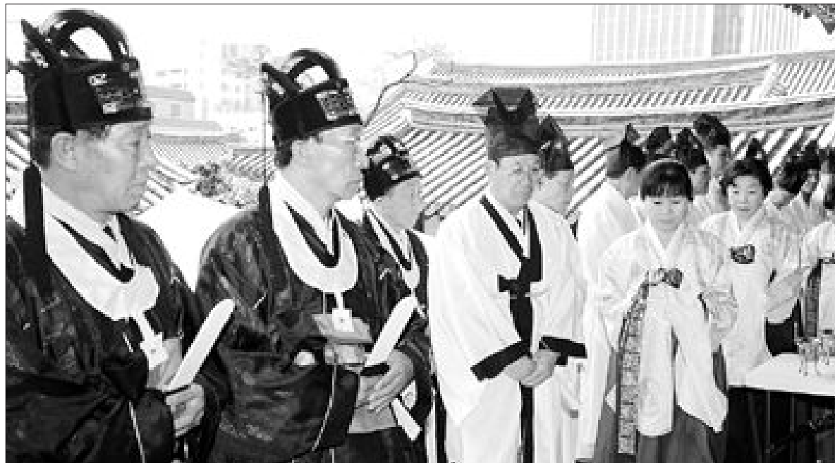
춘기 석전대제 춘기 석전대제(春期釋奠大祭)가 3일 광주시 남구 광주향교에서 열린 가운데 초헌관 등 제관들이 공자의 위패가 놓인 대성전 앞에서 예를 갖추고 있다.

이러한 고용유지지원금 제도를 적극 활용하기 위해 중소기업에 대한 고용유지지원금을 현행 근로자 임금의 3분의 2에서 4분의 3으로, 대기업의 경우 임금의 2분의 1에서 3분의 2로 각각 올리도록 했다. 또 근로자의 60% 이상을 재배치해야 지급하던 고용유지지원금 지급요건도 ‘근로자의 50% 이상 재배치’로 완화했다. 개정안은 이와 함께 기업의 경영악화로 무급휴업을 하는 근로자가 직업능력개발훈련을 받을 경우 일정 수준의 생계비를 대부하도록 했다. /연필뉴스