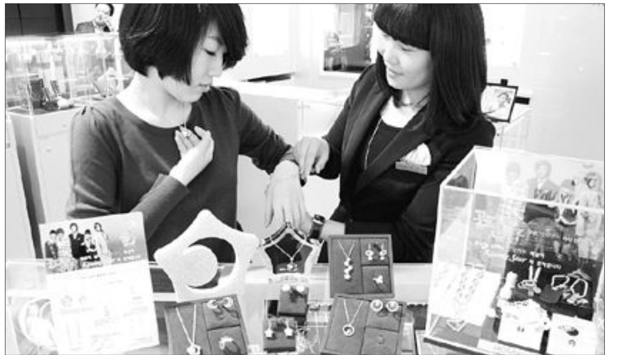
'꽃남 목걸이' 눈길 광주신세계 백화점 2층 잡화매장에서 화제 드라마 '꽃보다 남자'에 나오는 'kissing star'(별과달의 키스)목걸이를 선보여 여성 고객들의 눈길을 사로잡고 있다.

이 제공된다. <다양한 특별 혜택> 기아차는 LPI 차종 구입고객에게 'Green Family' 30만원 Money Back 이벤트(30만원 추가할인)를 실시한다. 또 기아차 매장을 방문하는 고객을 중응모권 작성 고객에게 추첨을 통해 1명을 뽑아 1억원을 증정한다. 현대차는 올해 자녀를 출산한 고객이나 1989년 이후 출생한 자녀가 3명 이상인 가구에 10~30만원의 할인 혜택을 주는 '사랑나눔 행복 이벤트' 행사를 진행한다. /최재호기자 lion@kwangju.co.kr