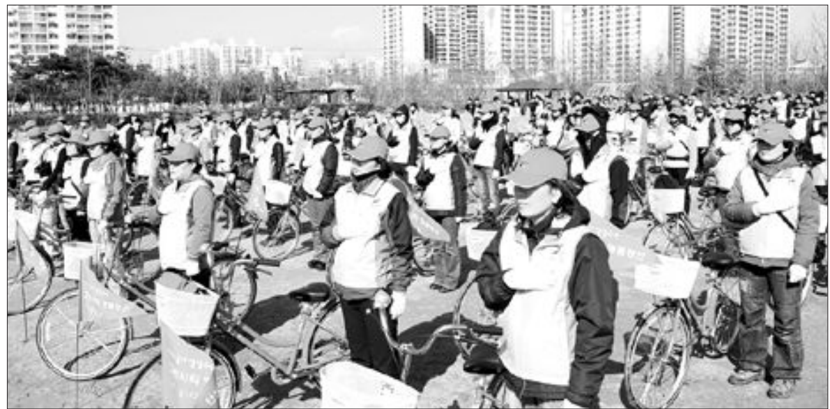
기초질서 지킴이 아줌마가 떴다. 광산구 ‘기초질서 열열주부운동’ (이하 열열주부단) 발대식이 최근 운남동 근린공원에서 열렸다. 120명으로 구성된 열열주부단은 자전거를 타고 지역을 누비며 기초질서 지키기 캠페인과 무질서 현장 계도 및 제보, 환경 취약지역 순찰 등을 벌인 다.

완도군은 지역의 소외계층 아동에게 교육, 건강, 복지분야 맞춤형 통합 서비스인 ‘드림 스타트 사업’을 운영한다고 최근 밝혔다.