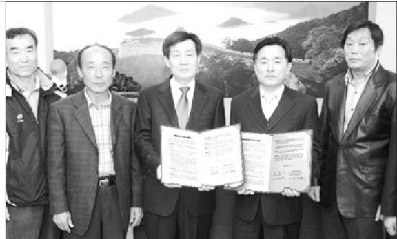
과제로 삼고 협조체계를 구축해 나갈 예정이다.

담양군 수북면에 위치한 한국작물연구소는 친환경농산물 생산농가에 대한 철저한 현장심사와 사후관리를 통해 친환경농산물에 대한 소비자들의 신뢰성 확보를 최우선