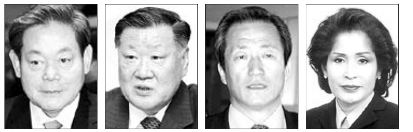
이건희 전 회장 정몽구 회장 정몽준 회장 이명희 회장

또 이씨는 “대기업이나 백화점 등에서 ‘제발 좀 와서 웃겨달라’는 문의가 쇄도하고 있다”며 “그만큼 웃을 만한 일이 없게 돼 인위적인 웃음이라도 필요하게 될 정도로 각박한 세상이 된 것”이라고 안타까워했다. 이에 따라 이씨는 올 연말에 ‘줌마’(아줌마)와 ‘저씨’(아저씨)들을 위한 전용 공연장을 만들 계획이다. 가족과 사회 발전을 위해 헌신하는 이들을 위해 전문 토크쇼가 필요하다는 생각에서다. 터놓고 얘기할 수 없고 성인들이 할 수 있는 토크쇼로 스트레스를 풀고 웃음을 되찾게 도와줄 예정이다. “다시 태어나도 개그맨을 선택할 겁니다. 수술이나 약으로 치료가 안 되는 스트레스를 웃음으로 해결할 수 있으니까요. 개그맨이 주는 웃음은 만병통치약이거든요.” /강필성기자 kps@kwangju.co.kr