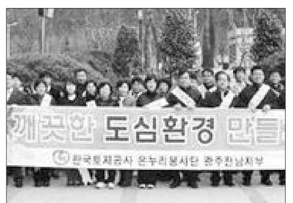
한국토지공사 광주전남본부는 지난 13일 5·18 자유공원 등에서 전 직원 등이 참여한 가운데 정화활동을 펼쳤다.