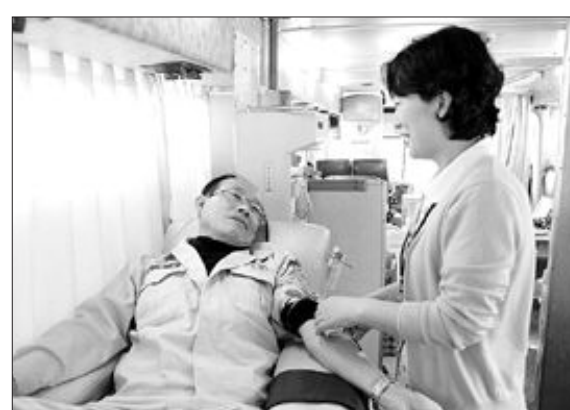
기아자동차 광주공장은 전 공장 임직원을 대상으로 12~17일, 26~31일 두차례 ‘2009년 사람의 현혈 캠페인 행사’를 실시한다.