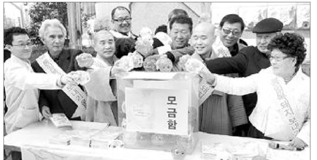
북한에 ‘통일 복돼지’를 보내기 위한 캠페인이 전개되고 있는 가운데 17일 광주 금남로 1가 무등빌딩 앞에서 열린 캠페인에서 참가자들이 저금통을 모금함에 넣고 있다.