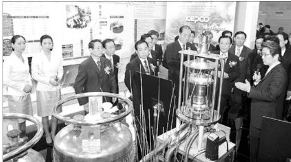
‘하늘 바람 땅 에너지전’ 2009 하늘 바람 땅 에너지전이 18일 김대중컨벤션센터에서 개막된 가운데 박준영 전남지사, 강박원 광주시의회의장, 최충만 광주시행정부시장 등이 ‘고온초전도 에너지 저장기술’에 대한 설명을 듣고 있다. 태양광, 수소·연료 전지, 바이오 등 신·재생에너지 관련 기술과 제품을 선보이는 이 전시는 20일 까지 열린다.