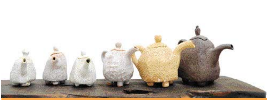
도자기 빚기를 좋아하는 사람들