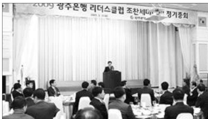
광주은행(은행장 송기진)은 지난달 31일 광주 신양파크호텔에서 우수 기업 고계 모인인 '광주은행 리더스클럽' 회원사 대표 120여명을 초청, 광주은행 리더스클럽 조찬 세미나 및 2009년 정기총회를 개최했다.