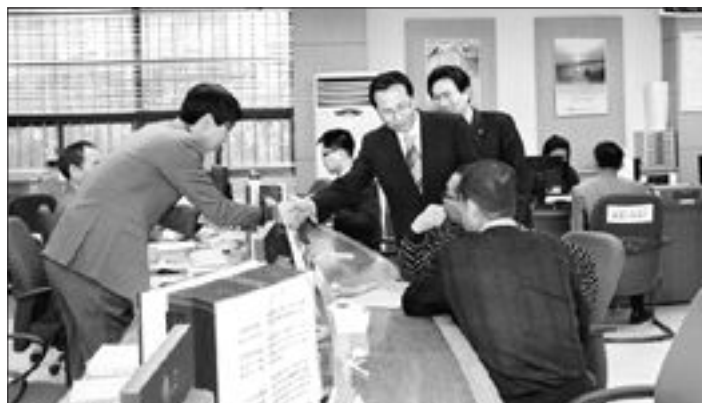
김광 광주지방국제성장장은 최근 서광주세무서를 방문해 법인세 신고 업무 진행상황을 점검하고 중사직원들을 격려하는 등 현장의 애로사항을 청취했다.