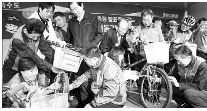
광주YMCA 빛고을바이크사업단과 광주시도시철도공사는 지난달 31일 서구 상무역 문화공연장에서 '광주지하철 무료대여자전거 이용거리 공동조사 발대식'을 열었다. 바이크사업단 등은 지하철 역에 비치된 자전거 100대에 거리측정계를 부착해 사용거리에 따른 이산화탄소 배출량을 측정, 기후변화 대응 자료로 사용할 계획이다.