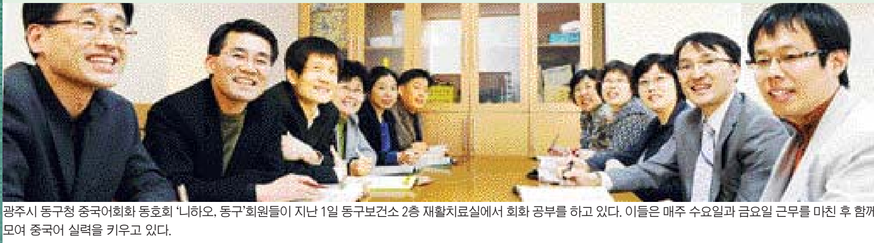
광주시 동구청 중국어회화 동호회 '니하오, 둥구' 회원들이 지난 1일 동구보건소 2층 재활치료실에서 회화 공부를 하고 있다. 이들은 매주 수요일과 금요일 근무를 마친 후 함께 모여 중국어 실력을 키우고 있다.