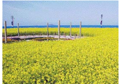
야외 정원의 유채꽃