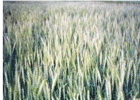
야외 정원의 밀밭