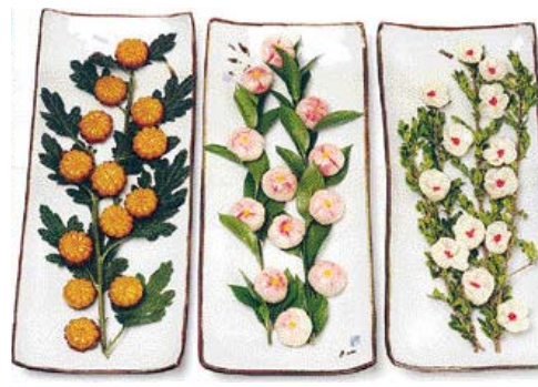
꽃 음식 전시