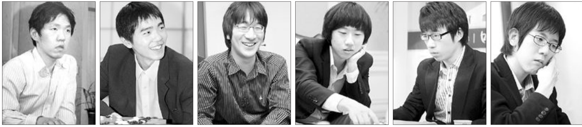
〈이창호 9단〉 〈이세돌 9단〉 〈박영훈 9단〉 〈최철한 9단〉 〈원성진 9단〉 〈강동윤 9단〉