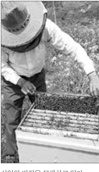
산업의 발전을 모색하고 있다. /보성=선상근기자 sun@

지난 2001년 개설한 카페 '꿀벌사랑 동호회'(cafe.daum.net/beelove)는 국내 양봉관련 최대의 사이트로 회원수만 8천여명에 달한다. 회원들은 카페를 통해 활발하게 양봉에 관한 정보와 지식을 교류, 양봉