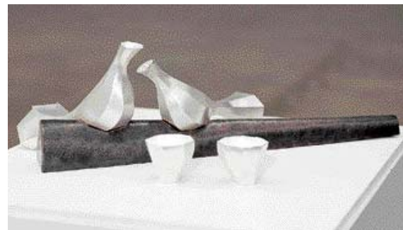
공예=김형희 '황조가 나뭇가지 위의 새와 대화'