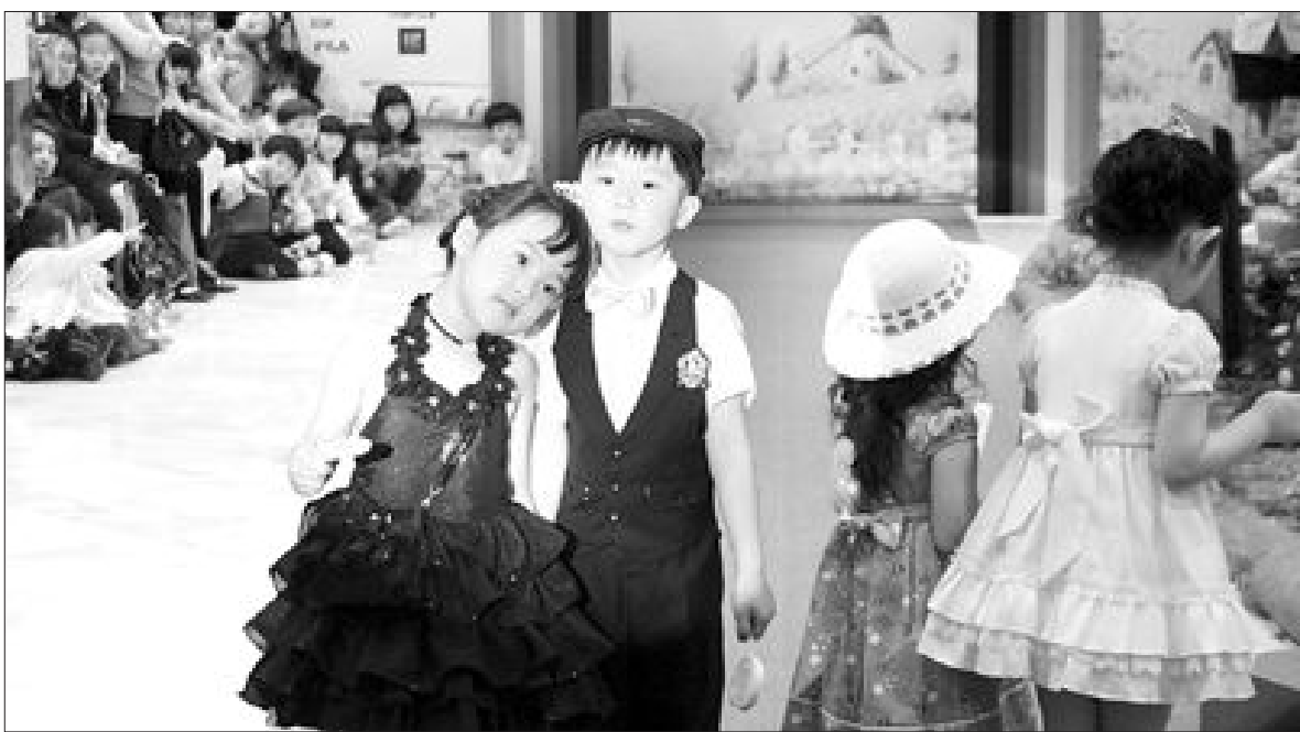
내가 더 예쁘지?

발을 통한 신규사업 추진(19.2%), '해외 신시장 개척'(11.1%) 등 자금난이 필요하다고 진단했고, 정부나 지자체가 '긴급운영자금 및 보증지원 확대'(34.7%), '원자재가 안정'(25.5%) 등에 힘써야 한다고 호소했다.