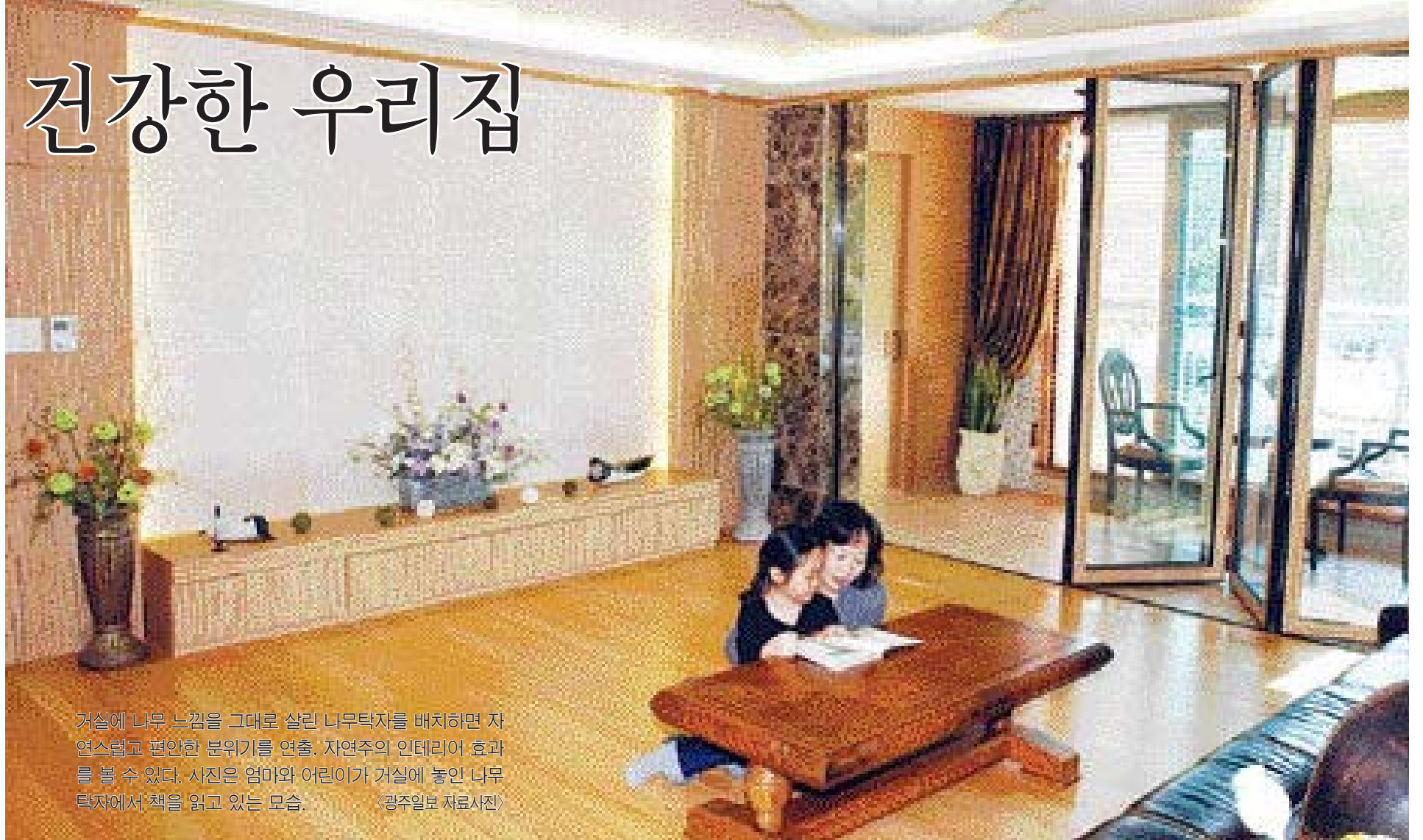
거실에 나무 느낌을 그대로 살린 나무탁자를 배치하면 자연스럽고 편안한 분위기를 연출. 자연주의 인테리어 효과를 볼 수 있다. 사진은 어머니와 어린이가 거실에 놓인 나무 탁자에서 책을 읽고 있는 모습.

도자기의 원료인 고령토나 점토 등으로 만든 점토벽돌이나 점토타일을 침실, 거실, 현관 등에 놓아두면 공기 정화 및 습도 조절 효과까지 볼 수 있다. 천연 흙색이나 자연스러운 느낌이 들고 가격도 2만원대(1박스·72장)로 저렴한 편이다. /이은미기자 emlee@kwangju.co.kr