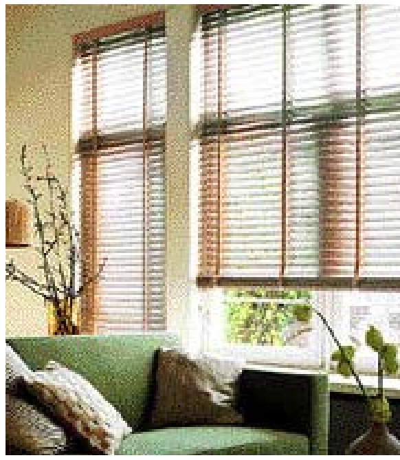
나무로 만든 우드 블라인드