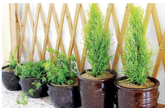
현관 입구의 응기화분