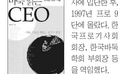
사에 입단한 후, 1997년 프로 9단에 올랐다. 한국프로기사협회 회장, 한국바둑학회 부회장 등을 역임했다. 저서로는 ‘반상의 파노라마’ ‘현대바둑의 이해’ 등 30여 권이 있다. <21세기북스·1만3천원> /오광록기자 kroh@