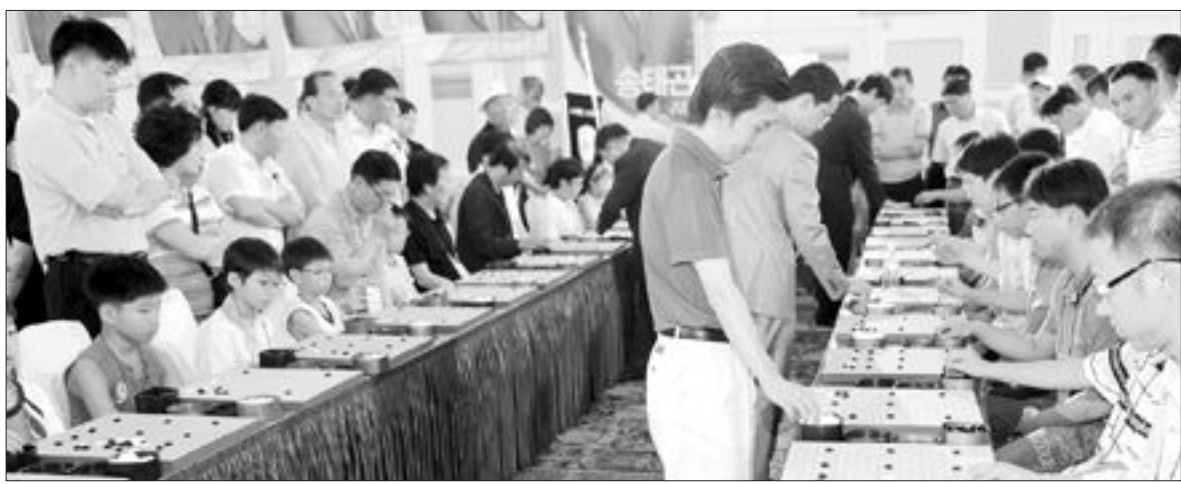
신안팀의 리그 참여 선언으로 2009 바둑리그에 7개 팀이 뛰게 됐다. 사진은 지난해 7월 광주에서 열린 2007 바둑리그 부대행사로 열린 프로기사들의 지도대면기 모습.