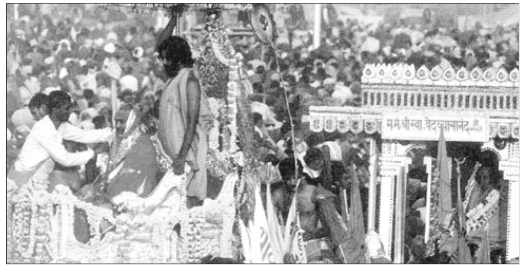
인도의 '아르드 콤브 메라 축제'. 이 축제에선 7천여만명의 순례자들이 영혼의 정화를 위해 갠지스강에 들어간다.

철저한 고증과 현장답사를 통해 저자는 알렉산드로스 대왕이 밟았던 원정로, 그리스와 아랍의 무역상들이 드나들던 '그랜드트림크로드', 1960대의 '히피 트레일' 등에 숨겨진 이야기들을 파헤친다. 또 은밀한 경전으로만 알려져 있던 '리크메다'(인도 최초의 역사문헌), '바가바드 기타'(인도 역사속에 전철은 지혜의 말씀 또는 경전), '카마수트라'(에로틱한 사랑에 관한 내용을 담은 힌두 문헌) 등에 잠들어 있던 상상력의 도시들을 눈앞에 펼쳐보인다.