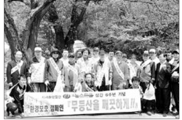
시사종합일간지 굿뉴스피플(대표 최왕식)과 한국환경자연연구협회(회장 김민진)는 최근 굿뉴스 피플 창간 6주년을 기념해 무등산 일원에서 자연보호 캠페인을 벌였다.