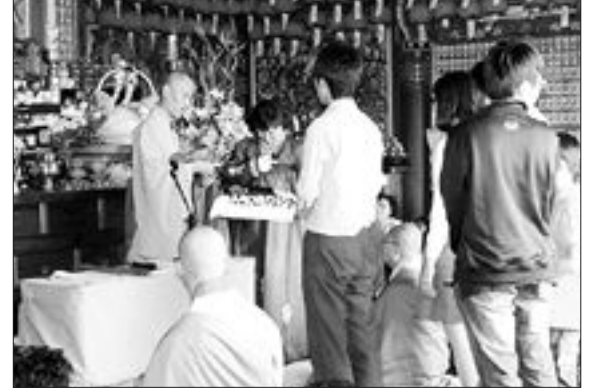
나주금성산 심향사에서 "부처님 오신날" 봉축법요식에서 지역 청소년 6명에게 장학금을 전달하고 격려했다.