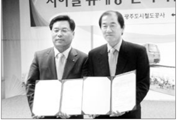
국제로타리 3710지구 2008~09년도 회장 총무단 협의회는 최근 광주시내의 모든 지하철탁사내에 1천여만원 상당의 휴게용 탁자 및 의자세트를 기증했다.