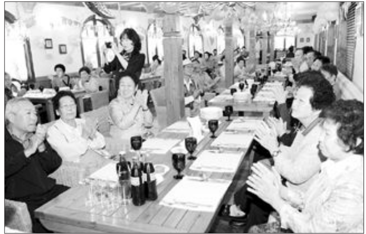
광주시 남구 방림동 옹프라우 레스토랑에서 지난 4일 가정의 달을 맞아 열린 무료 점심식사에 초대받은 독거노인과 소년소녀 가장들이 즐거운 시간을 보내고 있다.