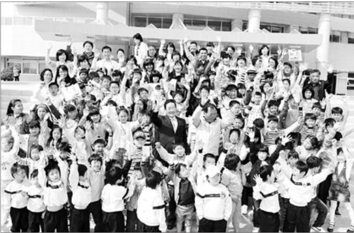
도교육청 남악 신청서 견학 줄이어

6일 첫 업무를 시작한 도교육청에는 7일 현재 전남지역 5개교에서 400여명의 학생들이 견학했다.