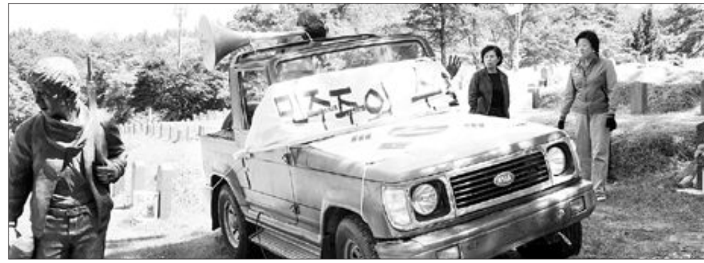
5·18광주민중항쟁 29주년을 맞아 지역 문화예술단체들이 다양한 문화 행사를 마련했다. 지난 9일 광주민예총이 5·18구묘역 앞에 설치한 항쟁 모습을 재현한 작품.