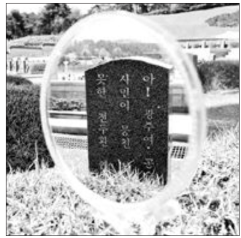
임신영 작 '겨울이 겨울아'

문화체육관광부 아시아문화중심도시추진단은 오는 17~30 까지 광주 대인시장 내 M갤러리에서 '아시아의 봄' 사진전을 연다.