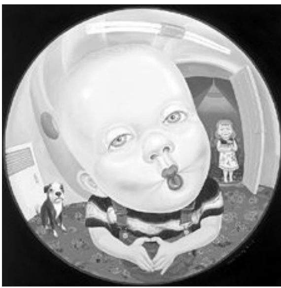
최재영 작 'guest'

한 색과 잔잔한 울림이 있는 작품을 선보였다. 또 유럽, 일본, 중국, 싱가포르, 대만 등지의 국제 아트페어와 기획 초대전에 참여하며 활동 영역을 넓혀나가고 있다. 문의 062-232-2328.