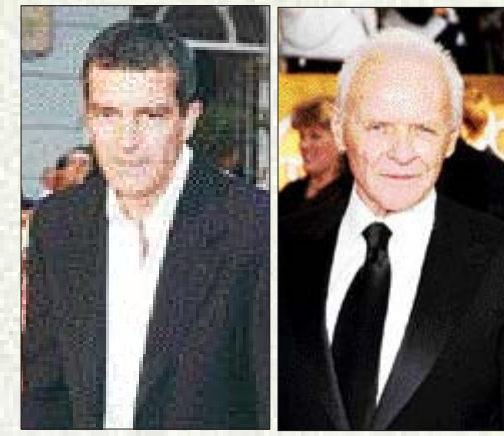
안토니오 반데라스 앤소니 홉킨스