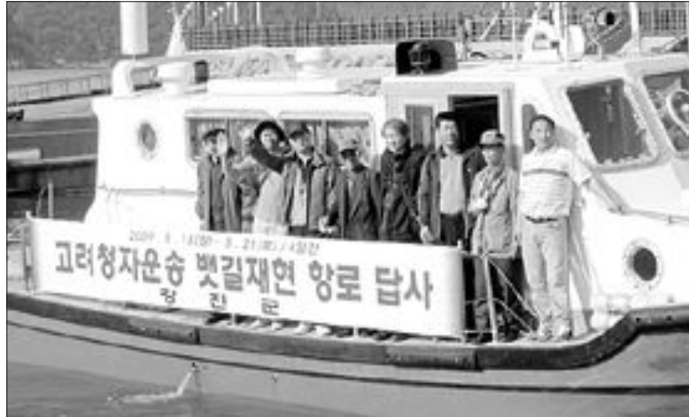
오는 8월초 고려청자 서해 뱃길 재현을 앞두고 18일 강진군 사전답사팀을 태운 군 어업지도선(전남 218호)이 마량항을 출항, 강화도 교통까지 550km 서해뱃길 답사에 나섰다.

강진군 ‘온누리호’ 뱃길 재현 앞두고 압해도~강화도까지 550km 사전답사