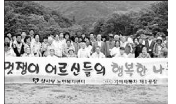
기아차 광주 1공장 임직원들은 최근 참가량오양림 등 광주 인근 독거노인 50여명을 초청, 장성 백양사와 담양리조트 등을 찾아 즐거운 시간을 보내는 '은빛 나들이' 봉사 활동을 실시했다.