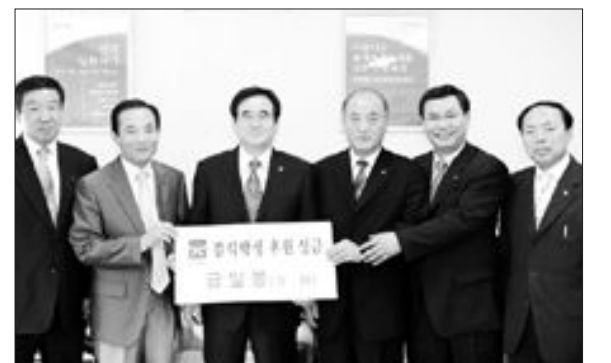
운광한 광주시교육청 교원정책과장(왼쪽 네번째)은 26일 한국교육자대상 부상으로 받은 상금 전액을 빛고을결식학생후원재단에 기부했다.