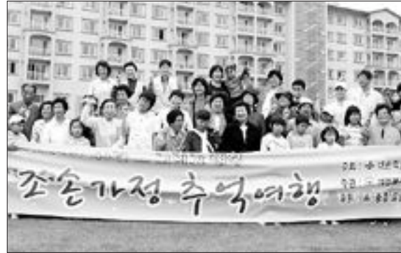
적십자사 광주전남지사 여성봉사특별자문위원회는 최근 나주 흥중골드스피리츠에서 광주전남지역 11가구 28명의 조손 가정 아들과 할아버지 등이 참석하는 '조손 가정 추억여행' 행사를 가졌다.