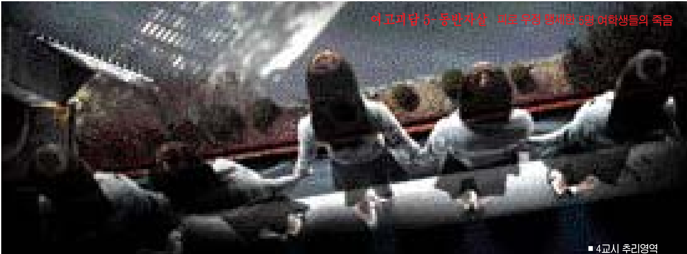
여고괴담 5-동반자살 피로 무정 맹세한 5명 여학생들의 죽음