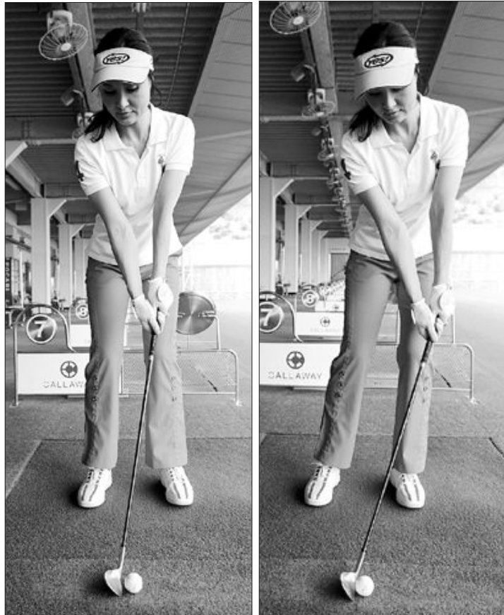
양팔과 클럽이 Y자 모양이 이뤄진 잘못된 어프로치 어드레스(왼쪽). 역 K자 모양의 올바른 어프로치 어드레스.

정 교수의 자세 중 또 하나의 특이한 점은 백스윙 때 히프가 유독 뒤로 빠져 있는 모습이었다. 이유는 상체와 히프가 동시에 회전하고 있었기