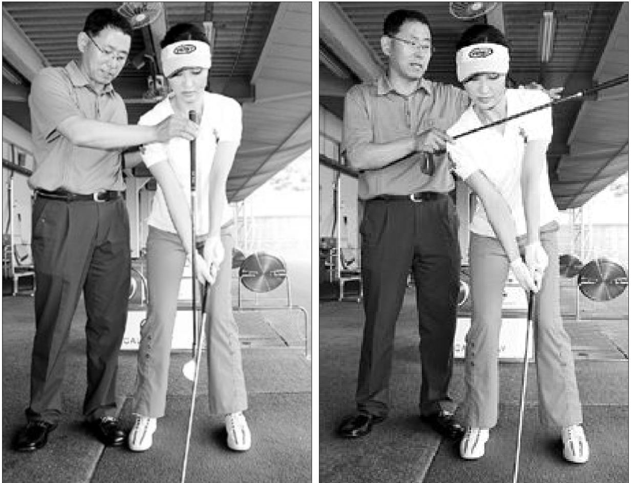
머리가 볼 위에 있고 어깨가 오른쪽으로 기울어지는 잘못된 어드레스(왼쪽). 어깨와 머리가 오른쪽으로 기울어진 올바른 어드레스.