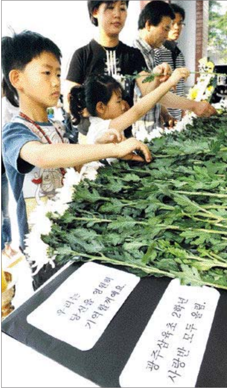
어린이들의 헌화 노무현 전 대통령 서거 후 옛 전남도청 분향소에는 추모객들의 발길이 이어지고 있다. 부모를 따라온 어린이들이 헌화하고 있다.