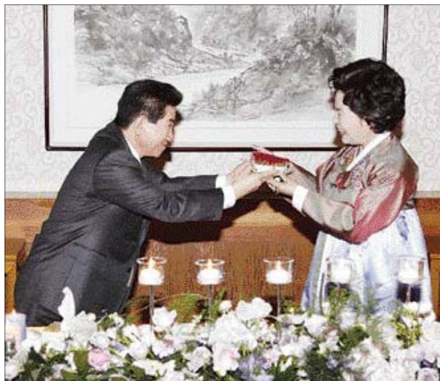
장미꽃 축하 노무현 전 대통령이 2008년 1월 30일 권양숙 여사 환갑 축하 행사에서 하트모양의 장미꽃을 전하고 있다.