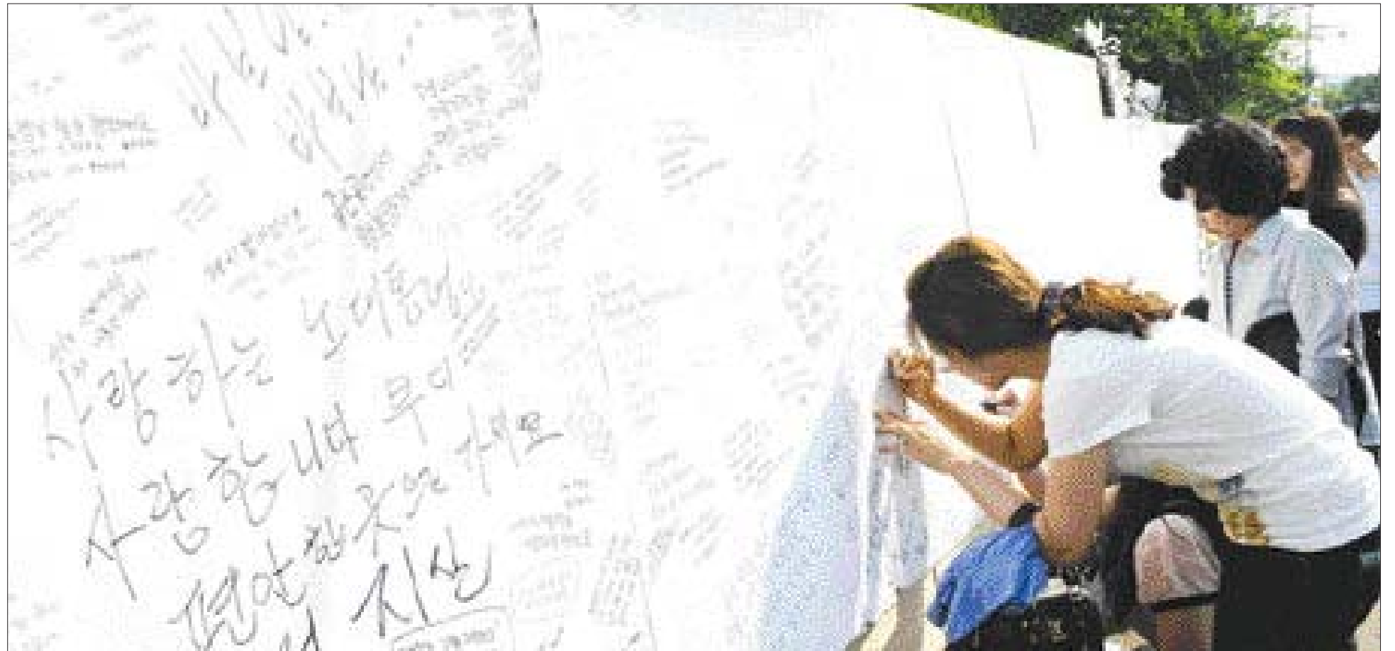
“편안한 곳으로 가세요” 노무현 전 대통령 서거 5일째인 27일 옛 전남도청 분향소에 추모객들의 발길이 끊이지 않고 있는 가운데 추모객들이 추모글을 남기고 있다.