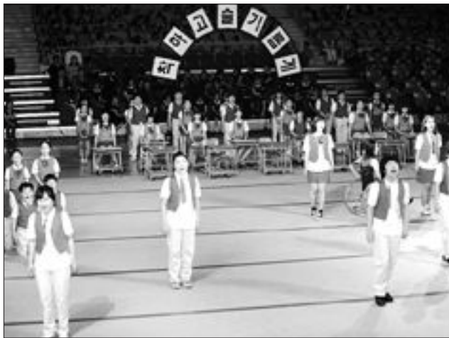
제38회 전국소년체전 개막식 식후행사 '하나된 너울'에서 열연을 펼치고 있는 화순 만연초등학생들.