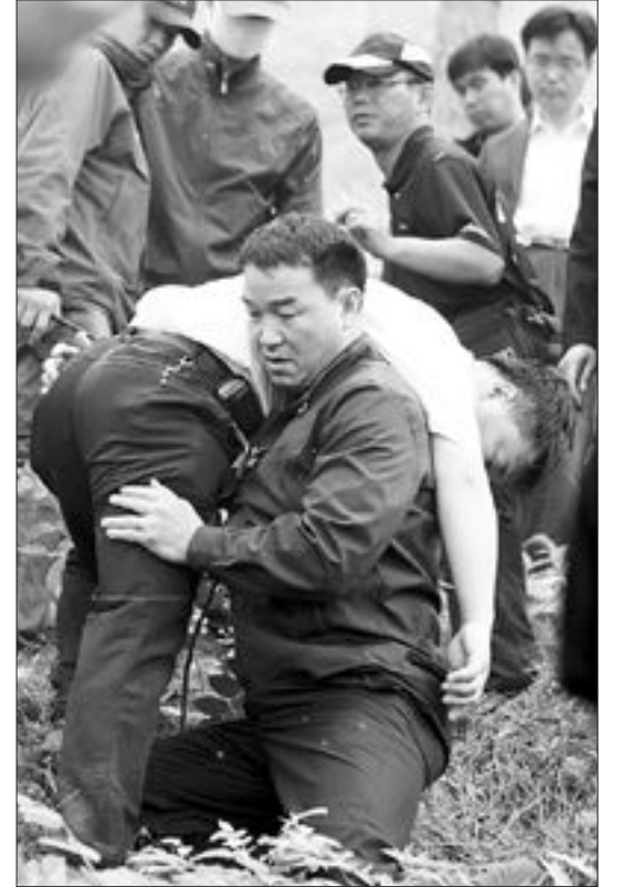
고(故) 노무현 전 대통령 서거 경위를 수사중인 경찰이 2일 오전 경남 김해 봉화산 부엉이바위 아래에서 현장상황을 재연하는 현장검증을 벌이고 있다. 의식을 잃은 노 전 대통령을 들쳐 메고 긴급하게 아래로 내려가는 모습.

현장검증 과정에서는 부엉이바위 부근 이정표 등에 노 전 대통령의 혈흔(핏자국)이 남아있는 사실이 확인됐다. 경찰 관계자는 “지난달 25일 국과수에 감정을 의뢰한 결과 노 전 대통령의 것과 일치하는 것으로 확인됐다”고 설명했다. 이 혈흔은 피를 흘리며 쓰러져 있던 노 전 대통령을 이 경호관이 어깨에 들쳐메고 산 아래로 내려가는 도중에 피 묻은 손으로 이정표를 잡