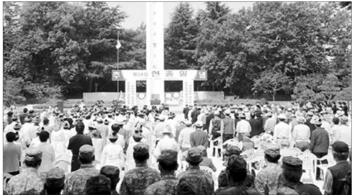
현충일 54돌 기념식 제54회 현충일 기념식이 지난 6일 광주공원 '우리 위한 영의 탑' 앞 광장에서 열리고 있다. 행사에는 국가 유공자와 유족, 보훈단체장, 기관 단체장 등 800여명이 참가했다.