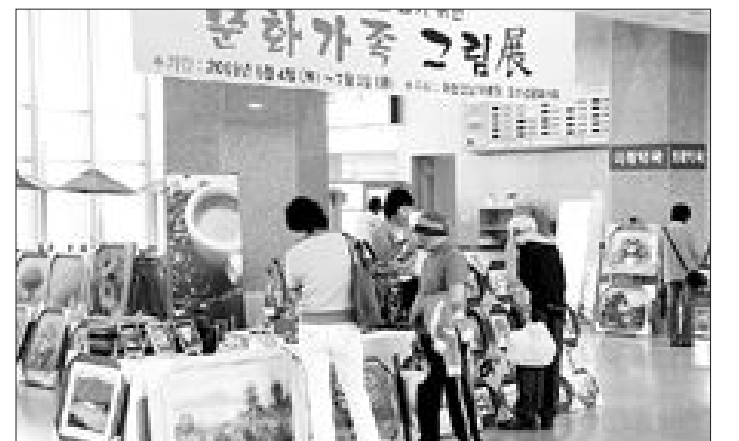
화순전남대학교병원(원장 범희순)은 다음 달 3일까지 1층 로비에서 ‘불우환우돕기’ 기금마련을 위한 미술작품 전시전을 갖는다.