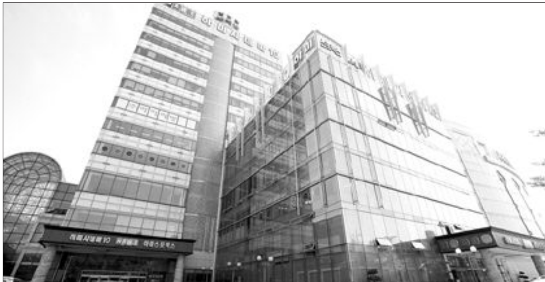
경기 체체가 지속되는데다 손님들의 발길이 줄어들면서 자금난을 겪지 못하고 경매 시장에 나오는 대형 상가건물이 잇따르고 있다.

특히 광주·전남은 덩치가 큰 상가건물이 붕괴로 경매시장에 쏟아져 나와 지역상권의 붕괴를 실감하게 하고 있다.