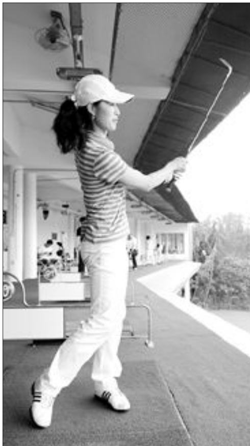
헤드업된 잘못된 자세(왼쪽)와 샷 후 고개를 들지않고 그대로 돌린 올바른 자세.

상체 '꼬임'은 초보자들에겐 결코 쉽지 않다. 아마추어 골퍼들 대부분 자신은 상체회전을 한다고 생각하지만 의외로 제대로 된 회전이 아닌 경우가 많다. 즉 히프가 돌아가지 않고 단순히 왼쪽에서 오른쪽으로 위치 이동만 하는 게 마치 돌아가고 있는 것처럼 착각을 하게 된다.