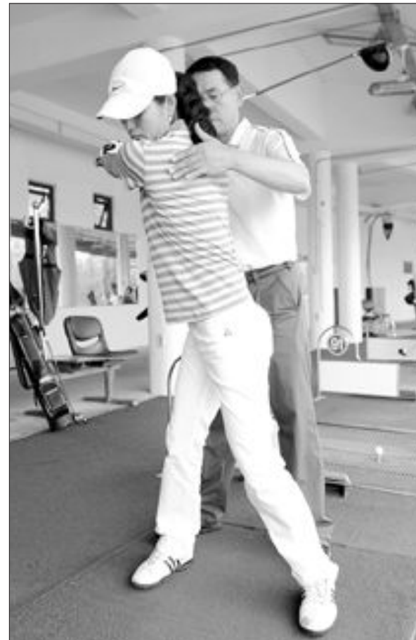
상체와 히프가 동시에 돌아가는 잘못된 히프트턴(왼쪽)과 상체 회전 후 히프가 돌아가는 올바른 자세.