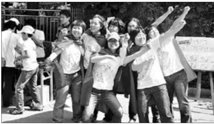
광주국학원과 광주뇌교육협회가 공동주최한 '지구인의 날' 기념행사가 지난 14일 광주 중심사 입구 문빈정사 주차장 앞에서 열린 가운데 참가 회원들이 등산객들을 상대로 지구의 소중함을 일깨우는 퍼포먼스를 하고 있다.