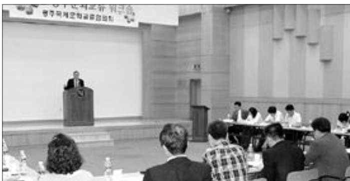
아시아문화중심도시 광주의 국제 문화교류 활성화를 위해 광주예총, (사)광주국제교류센터 등 민·관 단체들이 모여 출범시킨 광주국제문화교류협회의 워크숍이 22일 호남대 관스캠퍼스 교수세미나실에서 열렸다.