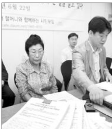
22일 광주시 동구 YMCA에서 열린 '근로정신대 할머니와 함께하는 시민모임' 회견에서 전범기업 미쓰비시에 항의를 촉구하는 서명서를 공개하고 있다.