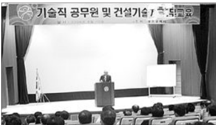
광주시는 최근 시 공무원교육원에서 기술직 공무원과 책임감리원, 현장기술자 등 400여명을 대상으로 '2009년 상반기 직무교육'을 실시했다.