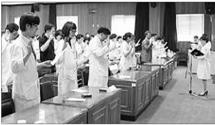
전남대병원 제5회 환자안전 및 감염관리 주간행사의 일환으로 최근 6층 7층 강당에서 안전한 병원환경 문화를 조성하기 위한 '환자안전 감염관리 선언서 선포식'을 가졌다.