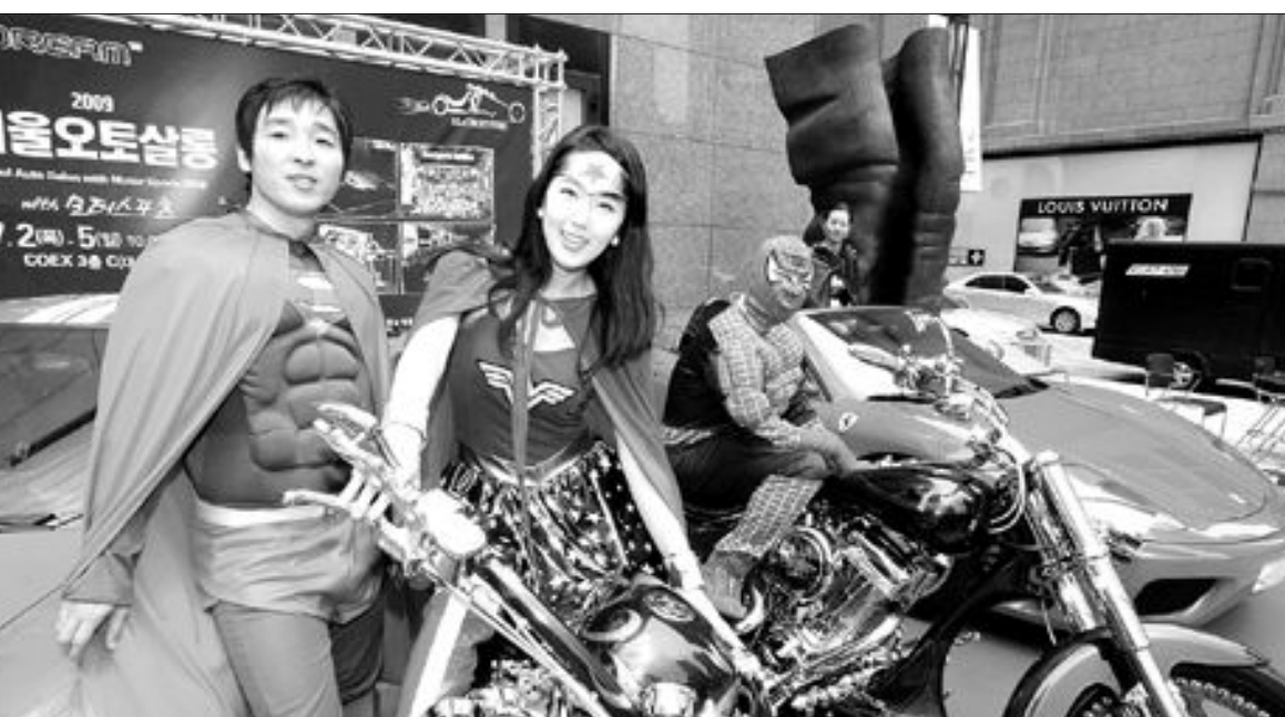
슈퍼맨과 튜닝을 ... 내달 2일부터 서울 코엑스에서 열리는 국내 최대 규모의 자동차 튜닝 전시회인 '2009 서울오토살롱' 홍보차 25일 신세계백화점 본점 앞에서 열린 이벤트에서 원더우먼, 슈퍼맨, 스파이더맨 의상을 입은 모델들이 취향에 맞게 튜닝한 커스텀 바이크와 자동차를 배경으로 포즈를 취하고 있다.

광양제철 미래비전 선포 포스코 광양제철소가 '세계 최대의 자동차·에너지 강재 전문 제철소'의 도약을 선언했다. 광양제철소는 25일 제철소 내 백운아트홀에서 'Dream Together, Dream works'라는 비전을 내걸고 세계 최대 꿈의 제철소 구현을 위한 새로운 도약을 다짐했다. 광양제철소는 새 비전을 "세계 철강산업을 이끄는 초일류 제조 프로세스를 완성, 세계 최대 자동차·에너지 강재 전문 제철소로 도약하자"는 의미를 담고 있다"고 설명했다. 새 비전에는 신뢰와 배려의 조직 문화를 바탕으로 구성원 전체가 꿈의 제철소를 만들어 나가자는 의지와 열정도 담겼다고 덧붙였다. 광양제철소는 이를 실현하기 위한 구체적 추진 계획으로 ▲고급 차량의 맞춤형 제조 기준 마련 및 운영을 통한 최고의 제조 프로세스 구축 ▲원가와 생산성 대비, 최고 효율인 2천 300만t 생산 체계를 기반으로 고객이 만족하는 제품 공급 등을 제시했다. 또 새 비전 달성을 위해 설비에 강하고 전문 분야에 대한 통찰력을 지