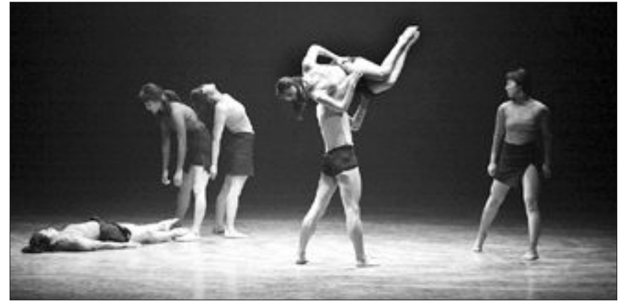
김미선무용단 '그들만의 Gate'.

광주로얄발레단은 박선희씨의 안무로 '루아흐'를 선보인다. 히브리어로 '호흡, 바람' 등을 뜻하는 '루아흐'는 서로 다른 색깔