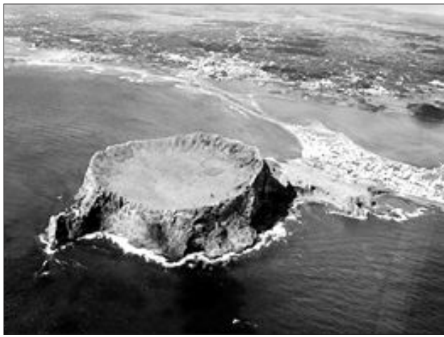
2007년 유네스코 세계자연유산으로 등재된 제주 화산섬.

조선왕릉(Royal Tombs of the Joseon Dynasty) 40기 전체(북한소제 2기 제외)가 27일 세계유산위원회(WHC) 정기총회에서 세계유산으로 등록된 것은 조선왕조 유산의 우수성을 세계로부터 인정받았다는 데 의미가 있다.